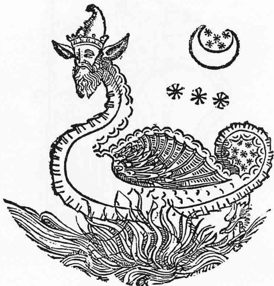
La Dernière Bête, celle qui fera tomber les étoiles avec sa queue. 6 (L'Ymagier n° 6, page 109.)