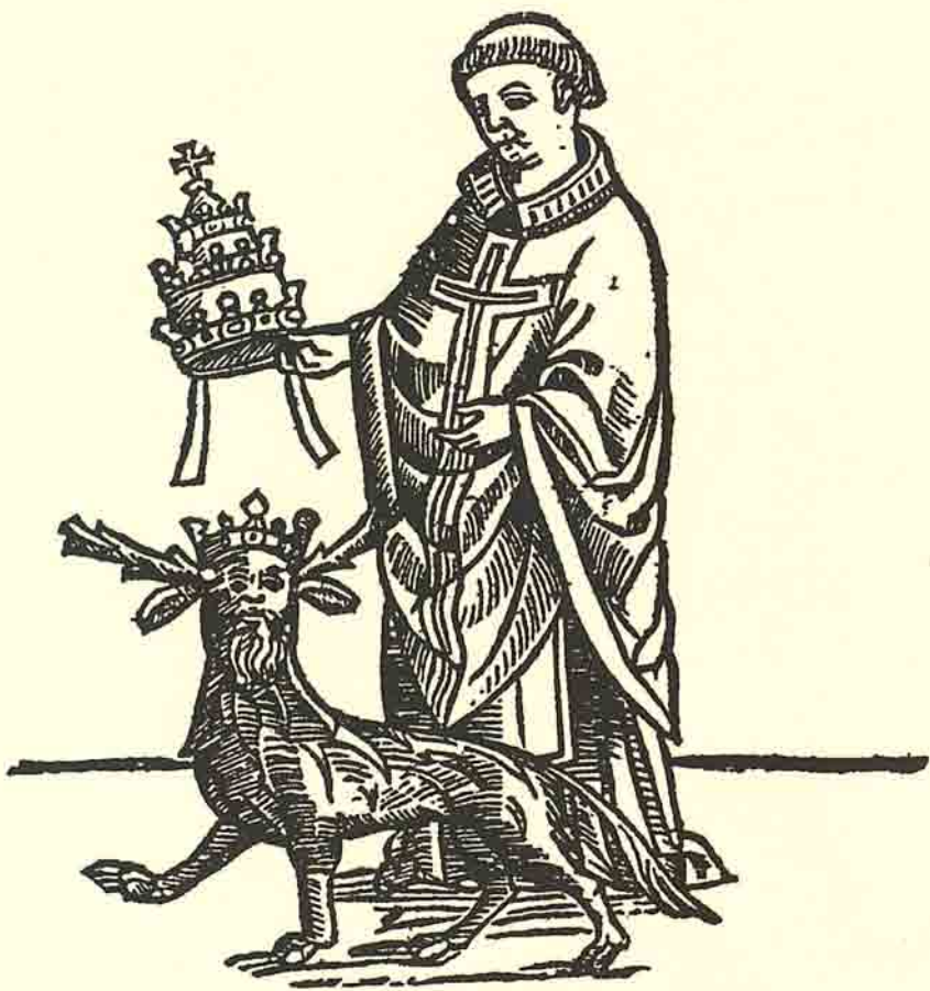
Image du Pape qui précèdera la venue de l'Antéchrist. ( L'Ymagier n° 6, page 107.)