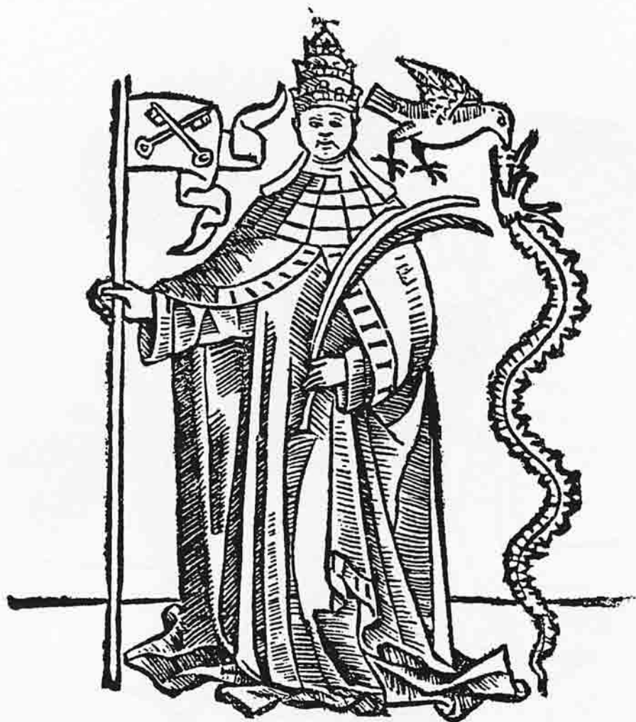
4 Le Serpent et la Colombe. Image du Pape Benoît XI. ( L'Ymagier n° 6, p. 101.)