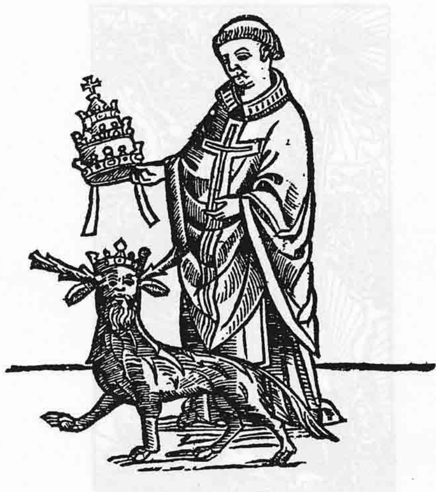
Image du Pape qui précèdera la venue de l'Antéchrist. (L'Ymagier n° 6, page 107.)