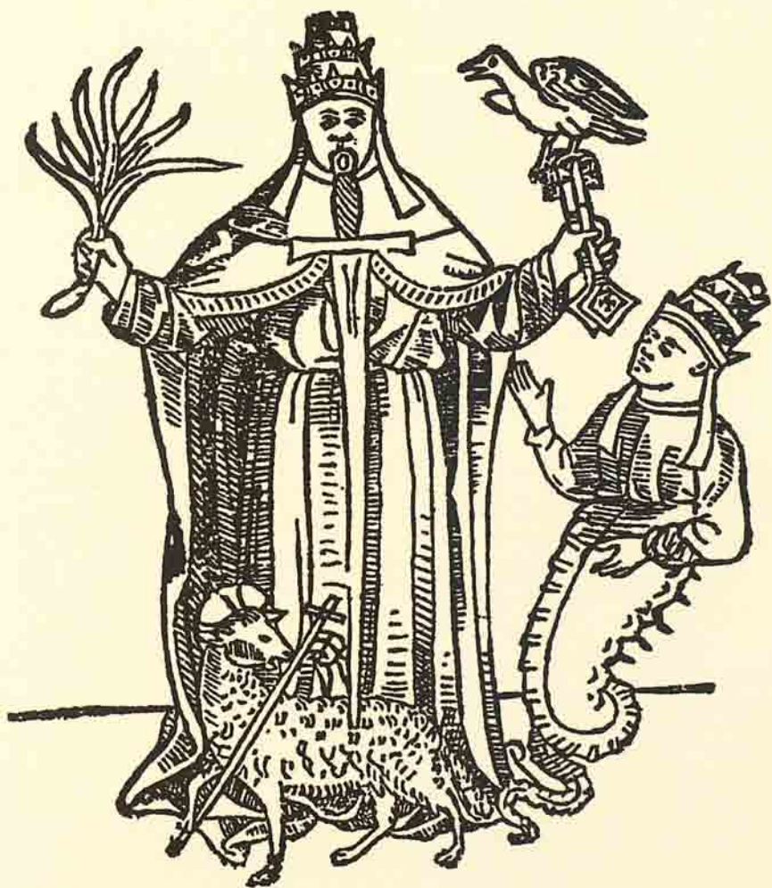
Le Pape dont la malice contre l'Agneau et le mépris pour les Clefs suscite un anti-pape. ( L'Ymagier n° 6, page 105.)