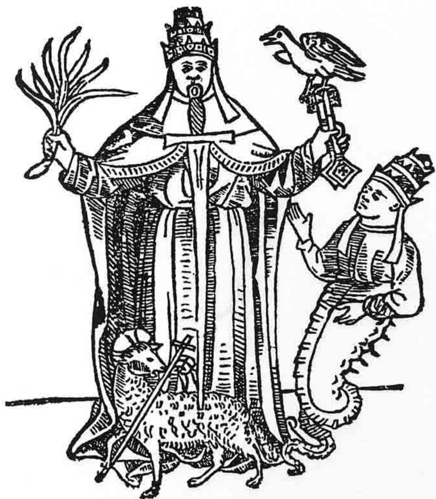
Le Pape dont la malice contre l'Agneau et le mépris pour les Clefs suscite un anti-pape. ( L'Ymagier n° 6, page 105.)