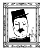
Le capitaine Bordure