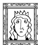
La reine Rosemonde

C'est le roi de Pologne. Il fait confiance à Ubu, qui le trahit et le tue, ainsi que deux de ses fils, à la revue militaire.